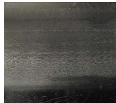
洗浄後(他社品) (はく離残しがある)

※ポリウレタン配合樹脂仕上剤を10層塗布して十分に養生した後、ウォッシュアビリティータスターを使用してはく離状態を確認した。