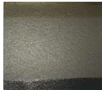
洗浄後(プロX) (完全にはく離している)